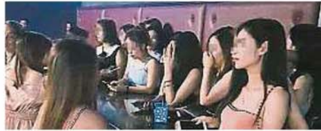
14名越南籍陪酒女郎遭警方逮捕，押回警察总部做进一步调查。