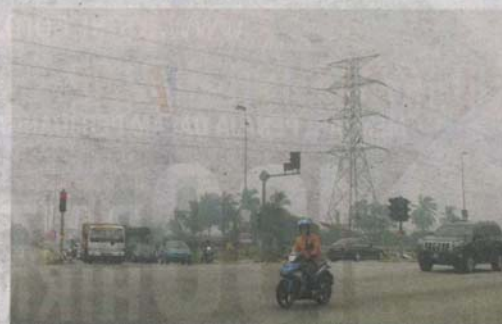
KEADAAN cuaca berjerebu ketika tinjauan di Jalan Klang-Banting semalam.

Tambahnya, semua sekolah terlibat diingatkan supaya merujuk kepada Prosedur Operasi Standard Penutupan Sekolah Berikutan Kejadian Jerebu bertarikh 18 September 2019 dan mengambil tindakan selaras dengan kenyataan dalam surat siaran tersebut.