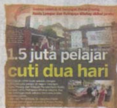
KERATAN Kosmo! 19 September 2019.

"Sekiranya bacaan IPU di kawasan masing-masing melebihi 200, pihak sekolah perlu mengambil tindakan selaras