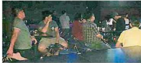
警方在取缔行动中检查了22名男顾客。